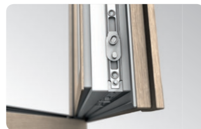
Hochwertige Maco Multi Matic KS Beschläge mit zwei aushebelungssicheren Schließblechen als Standardausstattung.