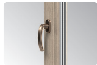
Der elegante Aluminiumgriff unterstreicht des Fensters.

Die Auswahl an Renolit-Folien in 43 Farben ermöglicht die Anpassung des Fensters an den Charakter aller Innenräume und an jeden Fassadenstil.