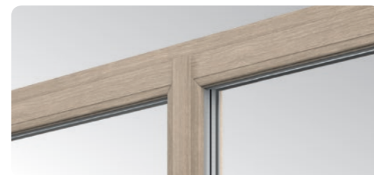
Die schlanken Profile mit schmalem sowie mit doppelter Dichtung ausgestattetem Stulp stellen eine Marktneuheit bei dieser Art von Lösungen dar.